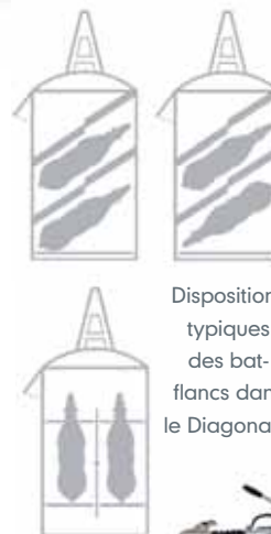
Dispositions typiques des bat-flancs dans le Diagonal 2