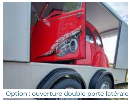
Option : ouverture double porte latérale